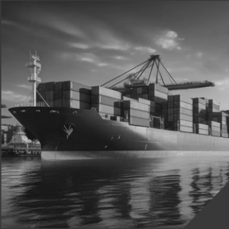
ShipOwner's Protective Agencying Agency