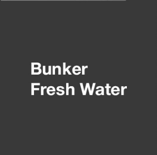
Bunker Fresh Water