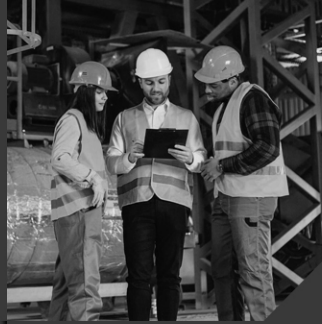
Bunker Fuel Oil