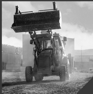
Rent Heavy Equipment